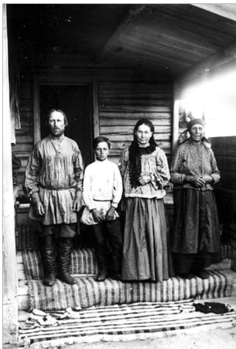
Ил. 2. Крестьянская семья из д. Ловатской Канского уезда Енисейской губернии.

Повседневные же головные уборы (чепцы или повойники) носили, по мнению Д. К. Зеленина, интимный характер, что делает обязательным их использование в сочетании с платком. Кокошники постепенно вытеснялись из употребления легкими повойниками, у которых появились и нарядные формы. В Сибири они назывались по-разному (табл. 3), но наиболее распространен был термин «шамшура» или «шашмура». Этот головной убор представлял собой достаточно жесткую шапочку из двух основных частей — плотного донца, клеенного из нескольких слоев ткани, и очелья на подкладе. Традиционные шамшуры несколько отличались друг от друга по крою. В одном случае они шились цельными, как шапочка. В другом варианте между незамкнутыми концами очелья вшивался клапан, внизу которого оставался зазор для вздержки. Шамшуру стягивали до нужного размера шнурком, который кре-