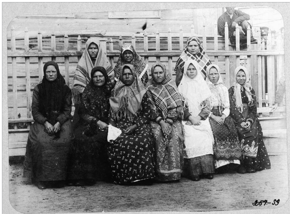
Ил. 1. Девушки казачьего поселка Кокчетавского уезда. 1911 г.