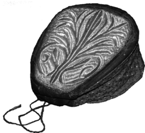
Ил. 3. Шамшура. Из фондов Новосибирского государственного краеведческого музея, инвентарный номер 19927-7. 2002 г.